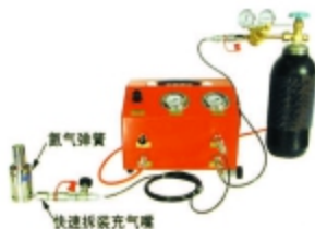
图1.2 增压充气 (用快速拆装充气嘴)