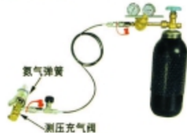
图2.1 非增压充气 (用测压充气阀)