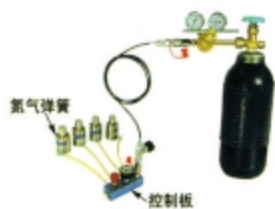
图2.3 非增压充气 (对控制板)