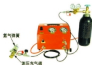
图1.1 增压充气 (用测压充气阀)