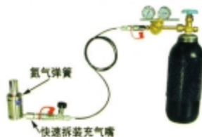
图2.2 非增压充气 (用快速拆装充气嘴)